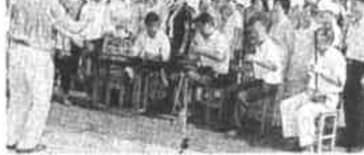
日前,胜利街道新兴社区、胜利油建公司精心编排了小品、歌舞等十二个精彩的节目,组成油地慰问团来到辖区内济军雷达站,与官兵们共同联欢,同时,该街道为官兵们带来慰问品,受到官兵们欢迎。

7月25日晚12时20分,辛店派出所干警马立锡、王江波、姜冬等巡逻至聊城路与梁山路交叉口时,见一年轻的女子正在追赶一名男子。该男子手拿一黑色手提包向东逃窜。干警们立即驱车手带上该女子实施追截。当追至胜利油田管具公司居民区路口时,该男子向北窜入一居民楼。干警下车继续追赶。当追至二楼时,见一名赤背男子正从三楼楼下,于是叫住予以盘问。该男子对此不予理睬,而是试图逃跑。当干警马立锡上前阻拦时,与之发生搏斗,该男子后被制服。经该女子指认,确定其为犯罪嫌疑人。