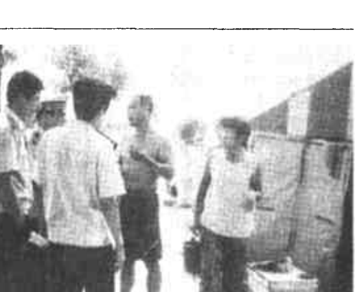
执法人员对养蜂人进行耐心说服教育,并对其讲解《城市市容和环境卫生管理条例》中相关规定。养蜂人当场将违章搭建的棚子拆除,并向执法人员保证,晚上将蜂箱一并迁走。(杨海鹏 陈学东 摄)

7月29日,市城建监察支队西城大队在巡查时发现东营区经济开发区对面黄河路南侧花砖路上,有两间临时搭建的养蜂简易棚,蜂箱排了20米左右,这一沿路占道乱搭行为不仅严重影响市容市貌,幸勤的小蜜蜂还不时“骚扰”路上急驰的车辆。执法人员对养蜂人进行耐心说服教育,并对其讲解《城市市容和环境卫生管理条例》中相关规定。养蜂人当场将违章搭建的棚子拆除,并向执法人员保证,晚上将蜂箱一并迁走。(杨海鹏 陈学东 摄)